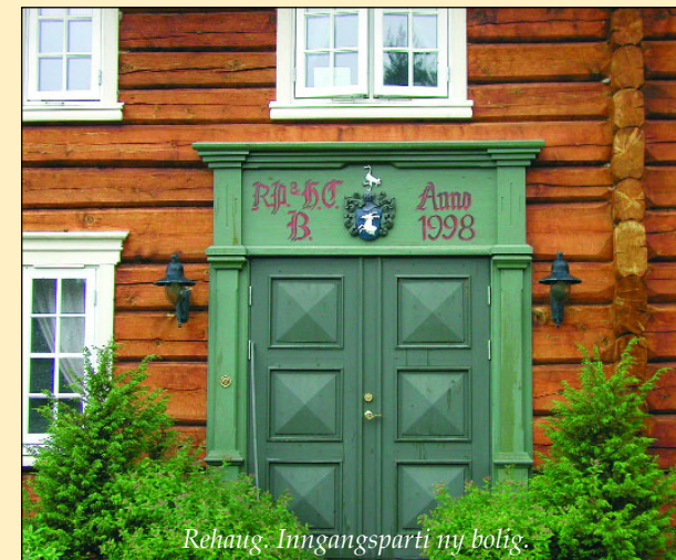
Rehaug. Inngangsparti ny bolig.